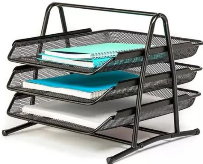
ITEM 29 Suporte Organizador De Documentos Papel Folhas A4 3 Bandejas