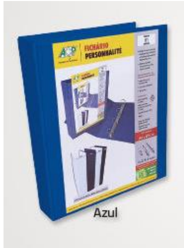
ITEM 24 Pasta Personnalité A4 40 mm c/ 4 argolas-Azul