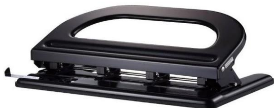
ITEM 49 Perfurador De Papel 4 Furos até 30 Folhas